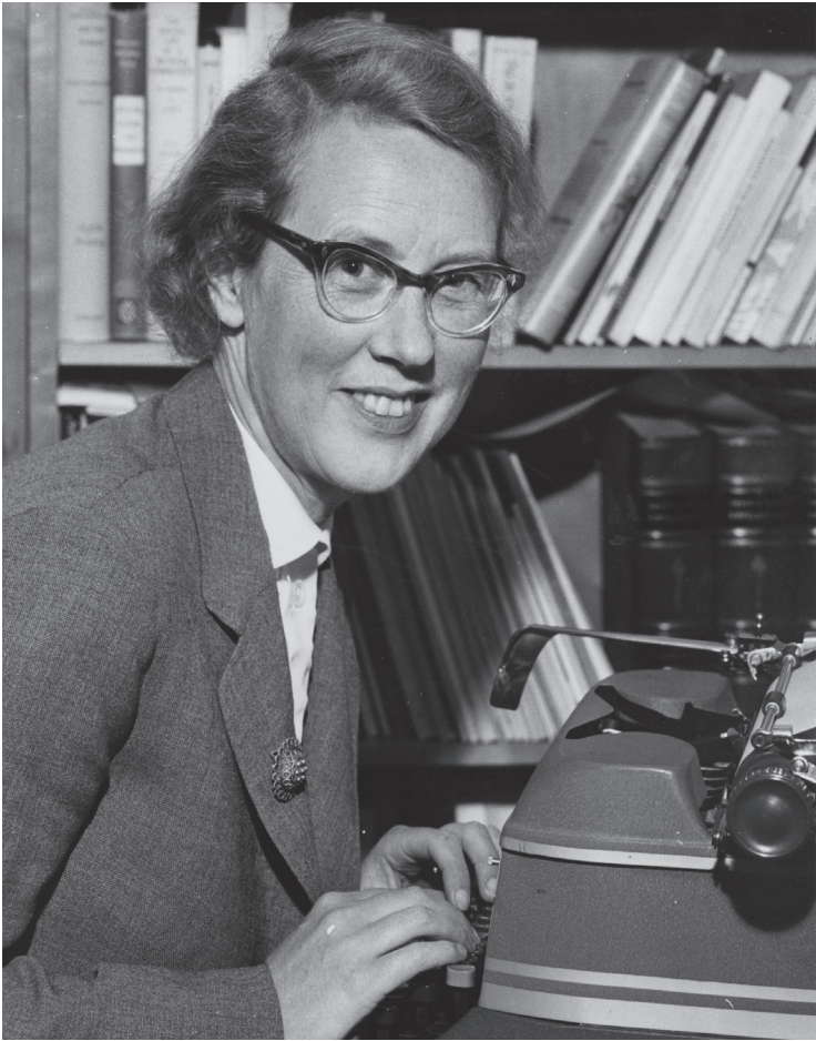
Signaturen Perfuga.

”Då detta upprepats några gånger var fru Segerstedt Wiberg, som antagligen tidigare varit misstänksam mot mig på grund av den långa, hårda striden om Morgontidningen , och jag goda vänner”, skriver Hjärne. 33